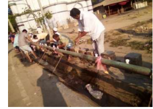
স্থানীয়দের উদ্যোগে পানির পাইপের সাথে হাত ধোয়ার জন্য সাবানের ব্যবস্থা করেছেন

তরুন সংগঠন গোয়েন্দা জেনারেশন অব বাংলাদেশ GGB তাদের নিজস্ব উদ্যোগে আরও তিনটি পয়েন্টে হাত ধোয়ার টিপিট্যাপযুক্ত ড্রাম স্থাপন করেন। এ নিয়ে মোট ৬টি পয়েন্টে হাত ধোয়া কার্যক্রম অব্যাহত রয়েছে। সংগঠনটির সভাপতি বলেন, কোস্ট ট্রাস্ট আমাদেরকে পথ নির্দেশনা দিয়েছে, স্বল্প খরছেই আমরা তিনটি হাত ধোয়ার ড্রাম তৈরী করতে পেরেছি। উক্ত ৬টি হাত ধোয়ার ড্রামে সংগঠনের সদস্যরা পানি ও টিপিট্যাপে সাবান মিশ্রিত পানি নিশ্চিত করছে। বাজার কমিটি এবং স্থানীয় জনপ্রতিনিধিও এ কার্যক্রমে যুক্ত হয়েছেন। বাজারের রিক্সা স্ট্যান্ডের দায়িত্বে নিয়োজিত শ্রমিকরা রিক্সার যাত্রী ও ড্রাইভারদের হাত ধোয়ার কাজে সহযোগীতা করছেন।