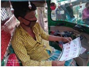
সিএনজি ড্রাইভার করোনা প্রতিরোধ লিফলেট পড়ছেন

করোনাভাইরাস প্রাথমিকভাবে হাত ধুয়ে রোধ করা যায়। তাই এই ভাইরাস প্রতিরোধে বাংলাবাজারে হাত ধোয়ার ব্যবস্থা গ্রহণ করেছে। পল্লী কর্ম সহায়ক ফাউন্ডেশন ও বেসরকারী উন্নয়ন সংস্থা কোস্ট ট্রাস্টের সহযোগিতায় স্থানীয় তরুন সংগঠন গোয়েন্দা জেনারেশন অব বাংলাদেশ (GGB) এর সদস্যবৃন্দ এতে স্বতস্পূর্ত অংশ গ্রহন করেন। বাংলাবাজারের মসজিদ