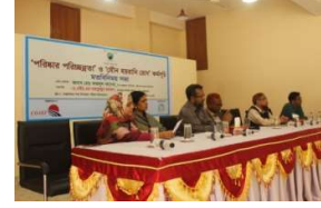
কক্স-সদর উপজেলা পরিষদে পরিষ্কার পরিচ্ছন্নতা বিষয়ক মতবিনিময় সভা

পরিষ্কার পরিচ্ছন্ন কর্মসূচি: কোষ্ট ট্রাস্ট ২০১৮ সাল থেকে কক্সবাজার সদর উপজেলায় পরিষ্কার পরিচ্ছন্নতা কর্মসূচি বাস্তবায়ন করে আসছে। কোষ্ট ট্রাস্ট ও পল্লী কর্ম সহায়ক ফাউন্ডেশনের যৌথ উদ্যোগে নিজস্ব অর্থায়নে কর্মসূচিটি বাস্তবায়িত হচ্ছে। কর্মসূচিটি স্থায়ীত্বশীলতার জন্য স্থানীয় কমিউনিটিকে যুক্ত করা হয়েছে। এলকার শিক্ষা ও ধর্মীয় প্রতিষ্ঠান, বাজার, জনপ্রতিনিধি, সামাজিক সংগঠনের নেতৃবৃন্দ কার্যক্রমের সাথে সম্পৃক্ত রয়েছে।