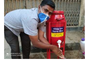
টিপিট্যাপ দিয়ে হাত পরিস্কার করছেন