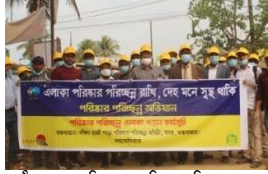
হাজীপাড়ায় পরিষ্কার পরিচ্ছন্ন বিষয়ক র্যালী

কর্মসূচির অংশ হিসাবে গত বছর ০৯ ফেব্রুয়ারি '১৯ ইং তারিখে সদর উপজেলা মিলনায়তনে