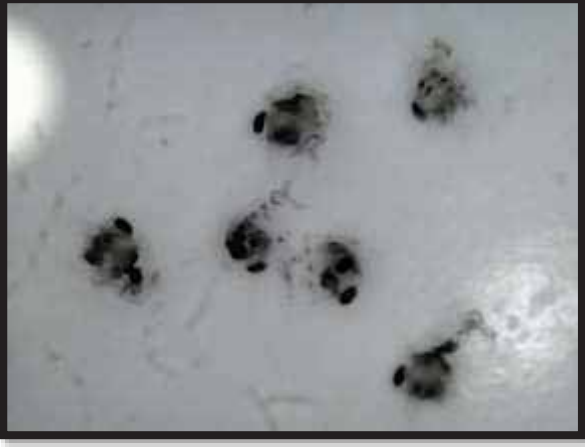
কাঁকড়া হ্যাচিং এর পর জোয়া-১ (জীবন পর্যায়) ,মাইক্রোস্কোপে ধারণকৃত