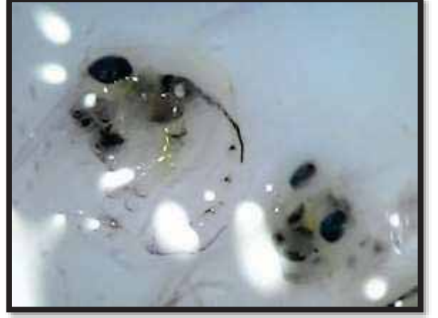
কাঁকড়া হ্যাচিং এর পর জোয়া-২ (জীবন পর্যায়) ,মাইক্রোস্কোপে ধারণকৃত

তারিখঃ ২ এপ্রিল ২০২২